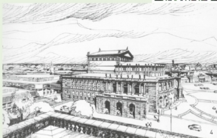
3 Der Semperclub zur Weihnachtsfeier 2009 im Saal der Drei-Königskirche 4 Zeichnung III. Semperoper, ehem. Chefarchitekt Dr. Wolfgang Hänsch