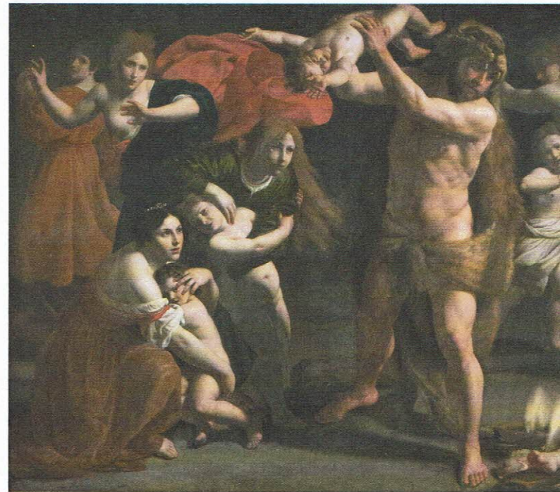
Alessandro Turchi, genannt l'Orbetto, Der rasende Herkules , Um 1620