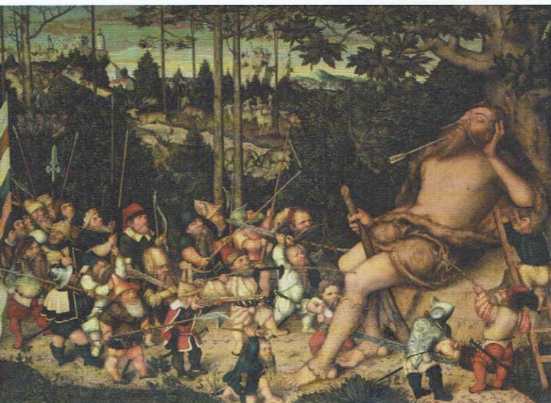
Lucas Cranach der Jüngere, Der schlafende Herkules und die Pygmäen , 1551 Gemäldegalerie Alte Meister, © SKD

The exhibition investigates the famous 'Labours of Hercules,' the hero's relationship with women, his anti-heroic escapades, and his role as a paragon of virtue for rulers such as Alexander the Great and August the Strong. Balthasar Permoser's 'Saxon Hercules' on the Rampart Pavilion (Wallpavillon) of the Dresden Zwinger bears witness to this. Hercules, as it turns out, was not only strong and virtuous. In some situations, he behaved dishonourably, succumbed to vice, or committed cruel injustices. The exhibition encourages reflection on the significance of heroism throughout history and its status in our society today. Particular attention is paid to the enormous narrative power and continued endurance of the myth.